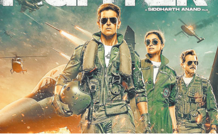
मुंबई। ऋतिक रोशन और दीपिका पादुकोण स्टार फिल्म फाइटर रिलीज के बाद बड़े पर्दे पर धूम मचा रही है। पहले दिन अच्छी कमाई करने के बाद अब फाइटर का दूसरे दिन का कलेक्शन भी सामने आ गया है। फिल्म ने पहले दिन बॉक्स ऑफिस पर 24.60 करोड़ रुपए का नेट कलेक्शन किया था। रिपोर्ट्स के मुताबिक, दूसरे दिन फाइटर ने बॉक्स ऑफिस 41.20 करोड़ रुपए का नेट कलेक्शन किया। रिपोर्ट के अनुसार, फिल्म का टोटल नेट कलेक्शन 65.80 करोड़ रुपए हो गया है।