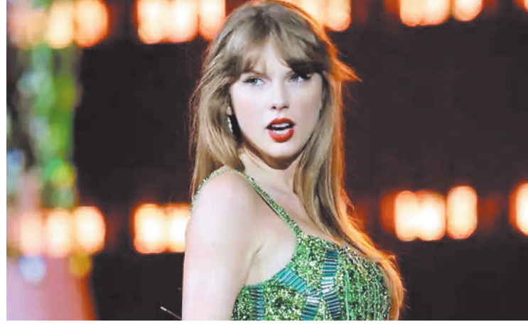
लॉस एंजेलिस। मशहूर पॉप सिंगर टेलर स्विफ्ट अब डीपफेक का शिकार हुई है, जिसके बाद बवाल मचा हुआ है। दरअसल एक्स हैंडल पर मशहूर पॉप सिंगर टेलर स्विफ्ट का डीपफेक फोटोज शेयर की गई। इसके बाद इस अकाउंट को सस्पेंड कर दिया गया। जैसे ही सिंगर के एआई जनरेटेड फोटोज सामने आए तो सोशल मीडिया पर बवाल हो गया और सभी ने इसका विरोध किया। यूजर्स ने कहा कि वो एक नेक इंसान है और उनके साथ इस तरह की हरकत करना बेहद शर्मनाक है।