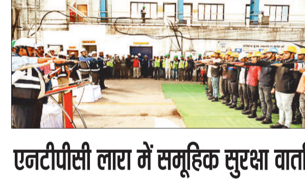
सर्वोपरी मानते हुए कार्य स्थल पर सुरक्षित कार्य सम्पादन करने के लिए सभी उपलब्ध उपाय किया जा रहा है। जिस के फल स्वरूप हाल ही में ऐसी कोई सूचिवद्ध दुर्घटना घटित नहीं हुआ है। इस अवसर पर कटिंग एवं वैलेंटिंग कार्य में नियोजित सौदाश्रमिकों को वैलेंटिंग आफरों का वितरण किया गया। सुरक्षा एक समूहिक कार्य है जिसमें सभी का सहयोग की जरूरत होती है। इसी को ध्यान मे रखते हुए एनटीपीसी लारा में कार्यरत सभी संविदा श्रमिकों को सुरक्षा के प्रति सचेत रहने के लिए प्रोत्साहित किया जाता है एवं सुरक्षा मित्र बनाए गए हैं। कोई भी श्रमिक किसी भी असुरक्षा की स्थिति में सूचित करने वाले को पुरस्कृत किया जाता है।