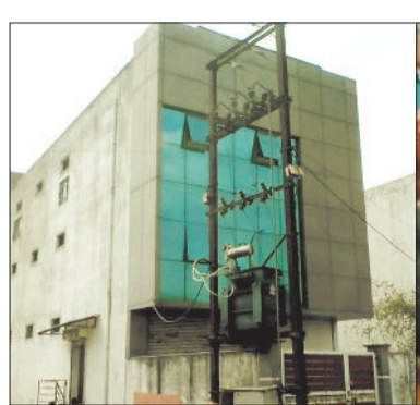
वह भवन जहां चल रहा था कार्यक्रम।

धर्मांतरण को लेकर आए दिन हिन्दू संगठनों और मिसनरी में विवाद होता रहता है। गरीब भोले भाले लोगों को शिक्षा स्वास्थ्य के नाम पर उन्हें बरगलाने के आरोप आए दिन लगते रहते हैं। इसी कड़ी में आज जिला मुख्यालय के सावित्री नगर स्थित बंद पड़े एक मकान के तीसरी मंजिले में एक समुदाय विशेष के लोगों द्वारा धर्म परिवर्तन कराये जाने की शिकायत पर मौके पर पहुंचे स्थानीय लोगों के साथ साथ आरएसएस हिंदू सेना व राम भक्त के साथ जमकर विवाद हुआ और इसके बाद पुलिस के बड़े अधिकारियों ने मौके पर पहुंचकर धर्म परिवर्तन कराने वाले एक दर्जन से भी अधिक लोगों को हिरासत में लेकर उनके पास से भारी मात्रा में बाईबल तथा अन्य किताबों के अलावा सामान जब्त किया है। यह मामला आज सुबह आया जब रायगढ़ के सावित्री नगर इलाके में धर्मांतरण को लेकर दो समुदायों के बीच में हंगामा करने का मामला सामने आए हैं दरअसल शहर के जुटमिल थाना क्षेत्र के सावित्री नगर में एक समुदाय के द्वारा कियाए के भवन में धर्मांतरण का कार्य किया जा रहा था जिसके बाद स्थानीय युवाओं और बजरंग दल के कार्यकर्ताओं ने भवन में चल रहे धर्म परिवर्तन कार्यक्रम को रुकवाया और