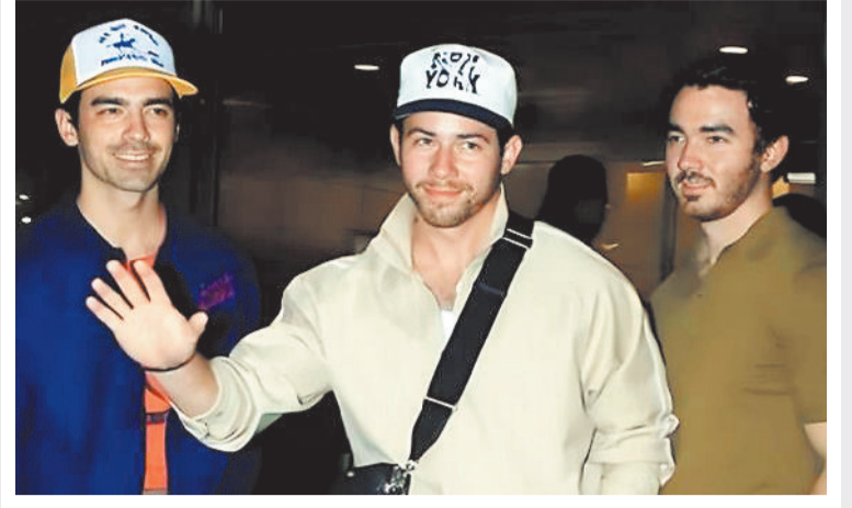
मुंबई। अमेरिकी पॉप रॉक बैंड जोनस ब्रदर्स शनिवार को मुंबई पहुंचे। वह एक कॉन्सर्ट के लिए इंडिया आए हैं। मुंबई के छत्रपति शिवाजी महाराज इंटरनेशनल एयरपोर्ट पर उतरे और पैराजो की लिए पोज दिए। वीडियो में निक को बेज रंग की शर्ट और पेट पहने देखा जा सकता है। उन्होंने वाइट स्नीकर्स, कैप और एक बैग के साथ अपने लुक को पूरा किया। केविन ने ऑलिव वॉन टी.शर्ट, काली पैंट और जूते पहने थे। जो ने ब्लू शर्ट और ऑरेंज टी शर्ट पहनी हुई थी।