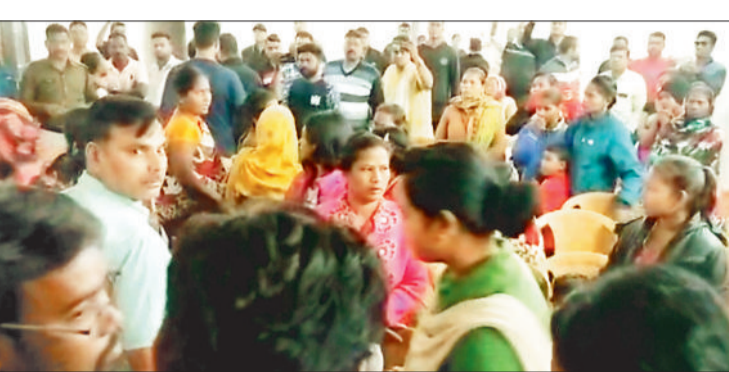
चंगाई सभा में शामिल समुदाय विशेष के लोग।